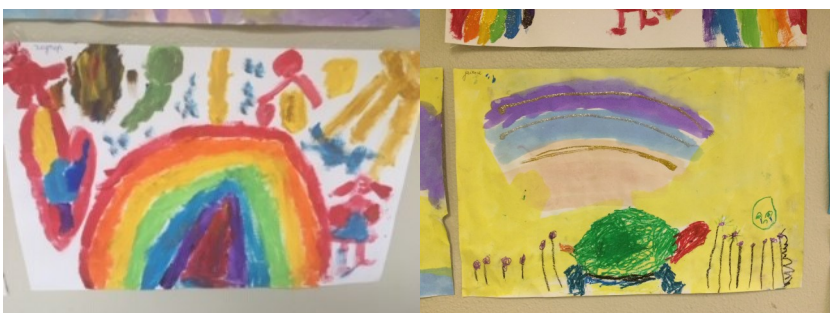
Werkjes uit groep 1/2