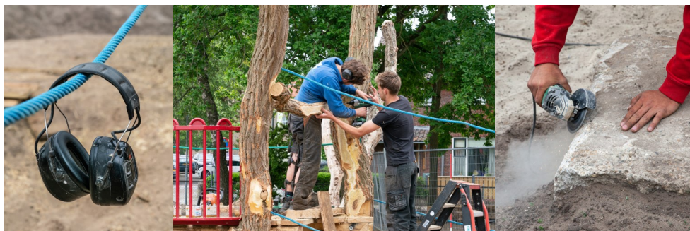
Ondertussen op het schoolplein...

'Fijn! Vanaf 8 juni zijn we weer compleet!'